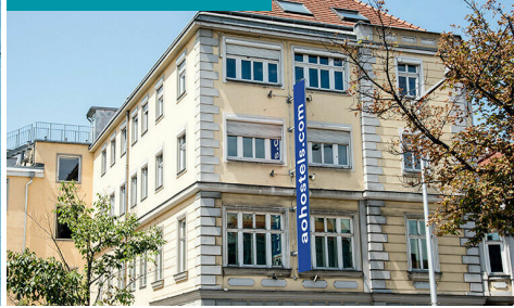
a&o Wien Stadthalle