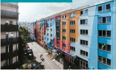
a&o Wien Hauptbahnhof