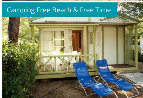
Camping Free Beach & Free Time