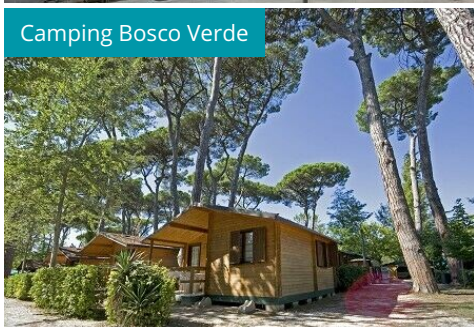
Camping Bosco Verde