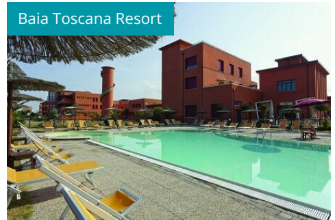
Baia Toscana Resort