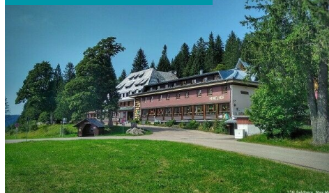
Skiinternat& Bregtal Hostel Furtwangen