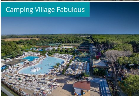
Camping Village Fabulous