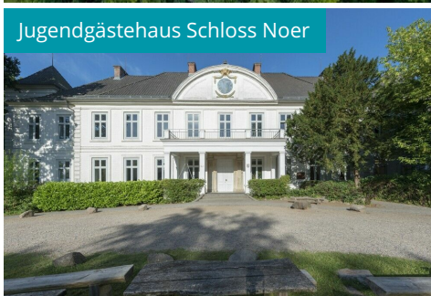
Jugendgästehaus Schloss Noer