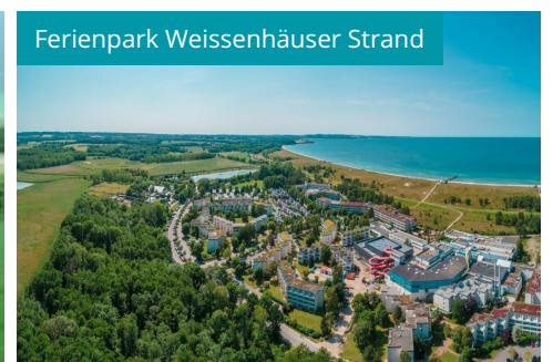
Ferienpark Weissenhäuser Strand