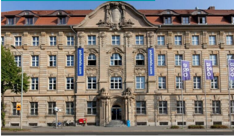
a&o Leipzig Hauptbahnhof