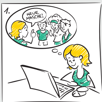
1. AKTION BESPRECHEN & ANMELDEN

Besprecht die Aktion in eurer Gruppe, bestimmt einen Koordinator und meldet euer Projekt an. Dann bekommt ihr ein kostenloses Starterpaket mit allen Unterlagen für die Aktion (Bestelllisten, Produktkataloge, Musterprodukte).