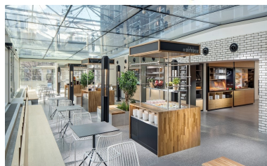
Frühstücks- und Restaurantbereich